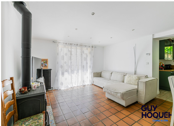
Photo du bien