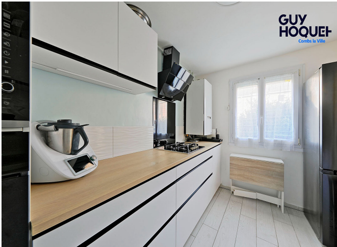
Photo du bien